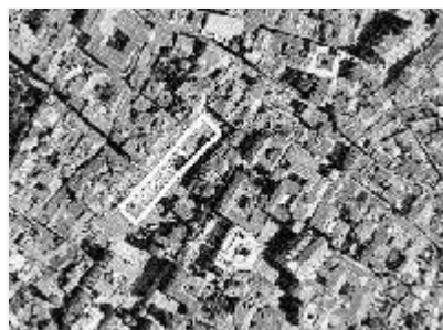
►► Plaza Mayor Imagen del callejero.

Ahora, ya no hay excusas para no saber dónde está la calle Manuel Castillo o la plaza de la Fe. Un solo click con el ratón, y listo. Cualquier rincón al alcance de la mano.